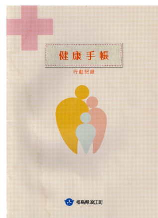
浪江町が発行し全町民に配布した「健康手帳」